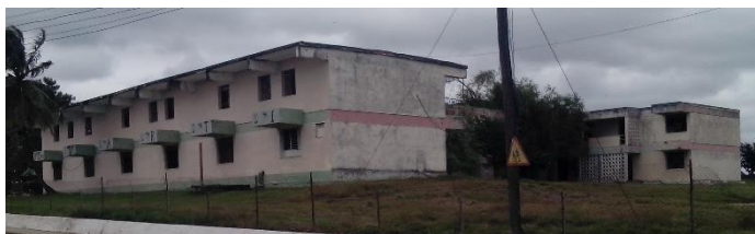
Dos bloques despintados y oscuros conforman la estructura constructiva de uno de los centros educativos más importante de Camajuaní.

El preuniversitario José Martí de Camajuaní se ha caracterizado tradicionalmente por poseer una excelente nómina de profesores, así como de graduar alumnos muy bien capacitados, para enfrentar las diferentes carreras universitarias, pero la institución hace tiempo está declinando en aspectos vitales de su funcionamiento. Se pudo realizar una indagatoria informal e incompleta, pues por razones obvias, no nos es posible otra cosa.