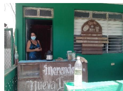
Un cuentapropista promedio, que no fue la que facilitó la información.

Los cuentapropistas de la gastronomía están en el límite de sus posibilidades. Para que se tenga una idea, tienen que pagar 200.00 CUP de impuestos mensualmente; 87.50 de seguridad social; el 10 % de sus ingresos al fisco y para facilitar la tramitación de la documentación: 25.00 pesos en el mismo periodo, a alguien especializado en la materia.